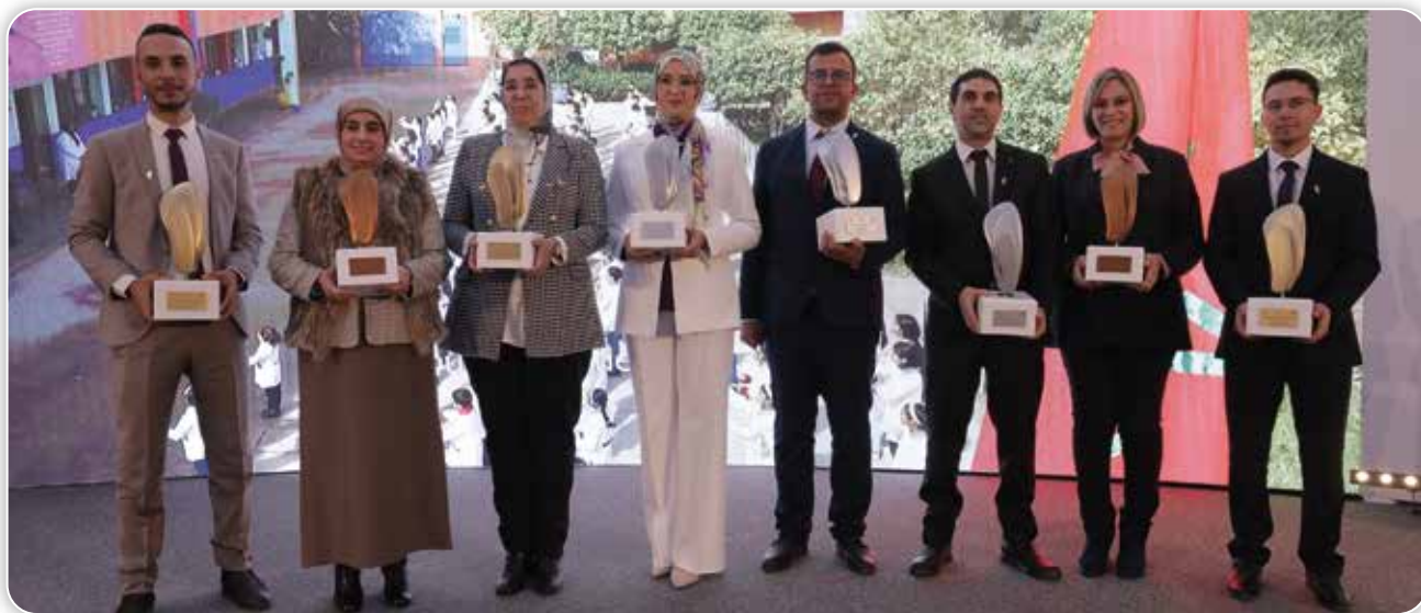
Photos de la cérémonie de la 4 ème édition