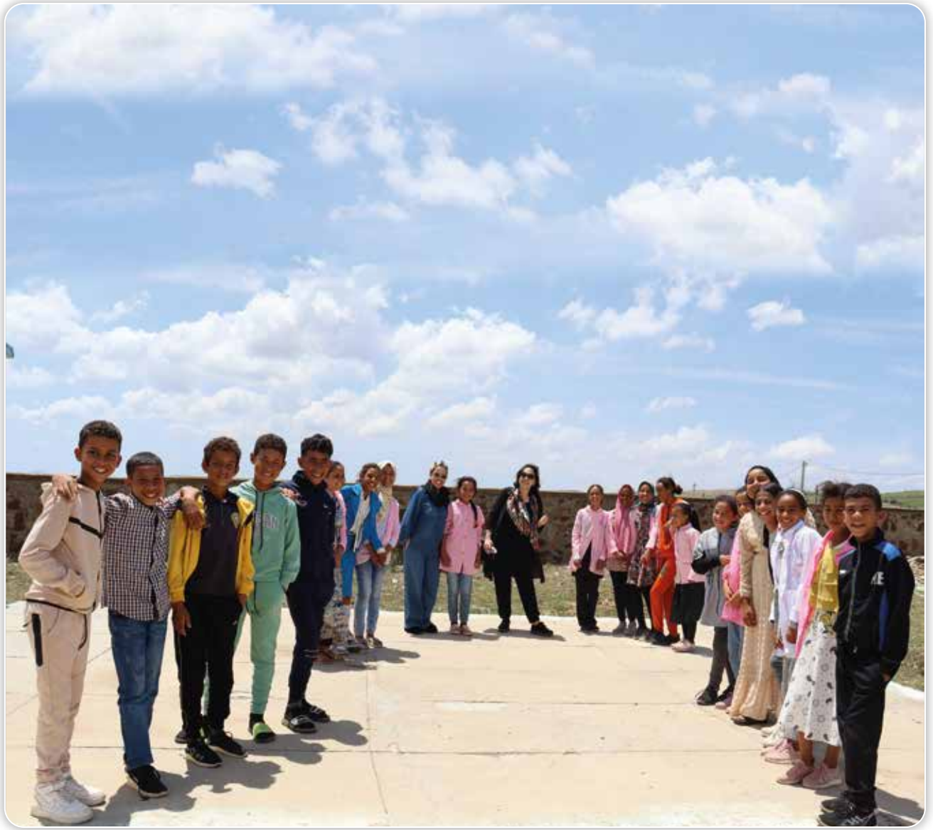
Visite dans une école à Larache - 5 ème édition